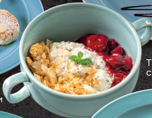
Творог с семенами чиа