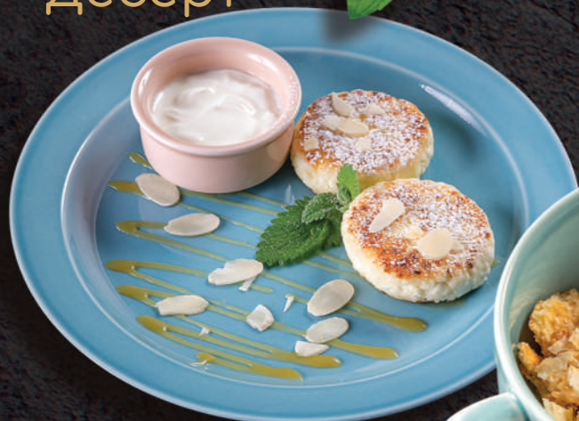
Сырники с соленой карамелью и добавками на выбор