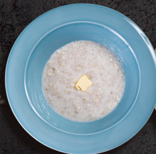
Овсяная на обычном или кокосовом молоке