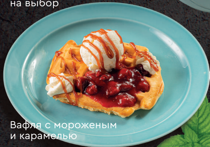
Вафля с мороженым и карамелью