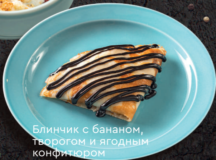
Блинчик с бананом, творогом и ягодным конфитюром