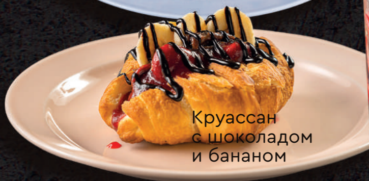
Круассан с шоколадом и бананом