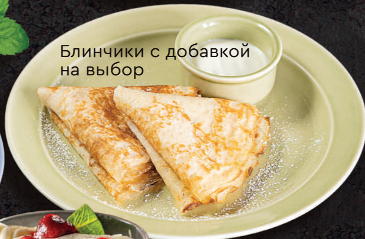
Блинчики с добавкой на выбор