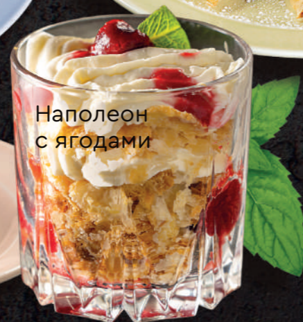
Наполеон с ягодами